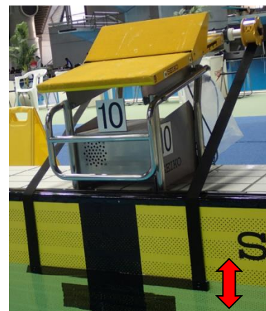
水面から±4 cmの上下動が可能